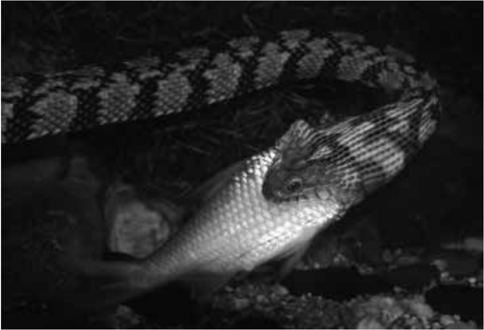
Fig. 11. Nerodia rhombifer in het aquaterrarium. - Fig. 11. Nerodia rhombifer in aqua-terrarium. (Picture Paul Storm).