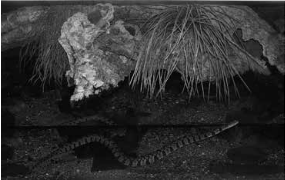
Fig. 7. Nerodia rhombifer in het aquaterrarium. - Fig. 7. Nerodia rhombifer in aqua-terrarium. (Picture Paul Storm).

door een volwassen vrouw, dan is het een ander verhaal. Alhoewel deze slangen geen grote tanden hebben, zijn ze groot genoeg om door de menselijke huid heen te gaan. Een beet van een waterslang kan er bloederig uitzien (Fig. 10). Maar, los van eventueel infectiegevaar, echt gevaarlijk is zo'n beet niet. In de praktijk bijten de slangen vooral wanneer je ze vastpakt. Indien je ze moet vangen en niet gebeten wilt worden, dan is het eenvoudigweg zaak wat dikkere handschoenen aan te doen, daar komen ze namelijk niet doorheen.