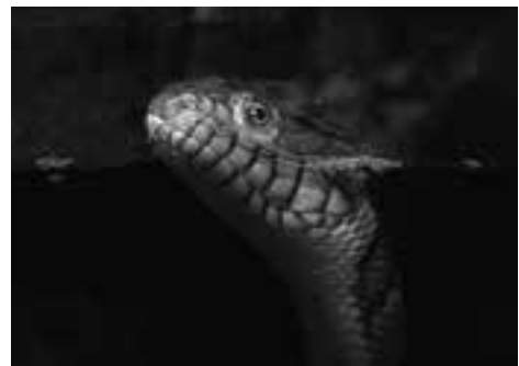
Fig. 8. Nerodia rhombifer in het aquaterrarium. Fig. 8. Nerodia rhombifer in aqua-terrarium. (Picture Paul Storm).

more opportunistic and eats fish as well as amphibians (Gibbons & Dorcas, 2005). Adult water snakes are usually easily fed in practice. The fish eating Nerodia rhombifer (fig 11) accepted thawed frozen fish and cat food. It looks like these snakes prefer eating in water. You can put dry cat food in the water bowl which will be eaten by