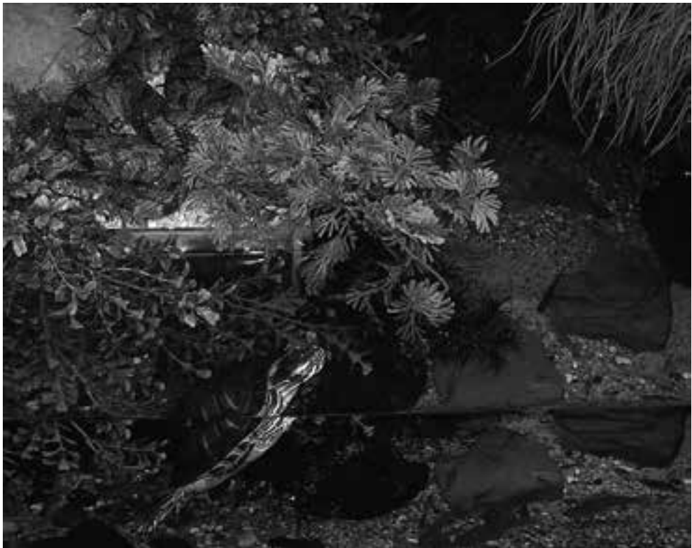
Fig. 9. Nerodia rhombifer samen met geelwangschildpad ( Trachemys scripta troosti ) in het aquaterrarium. (Foto Paul Storm). Fig. 9. Nerodia rhombifer together with Cumberland slider ( Trachemys scripta troosti ) in aqua-terrarium. (Picture Paul Storm).