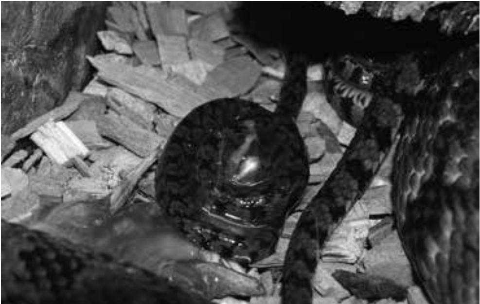
Fig. 12. Deze jonge Nerodia rhombifer heeft het moederlichaam net verlaten en zit nog in het eivlies. (Foto Paul Storm). Fig. 12. This young Nerodia rhombifer has just left the mother's body and is still in its egg membrane (Picture Paul Storm).