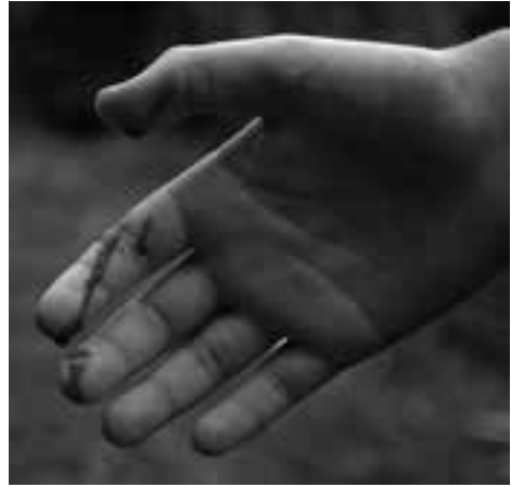
Fig. 10. Gevolgen van een beet van een kleinere Nerodia fasciata pictiventris in Florida.. Fig. 10. Consequence of a bite from a smaller Nerodia fasciata pictiventris in Florida..

In verband met het welzijn van de dieren en de voortplanting kan het verstandig zijn, afhankelijk van het oorsprongsgebied, de