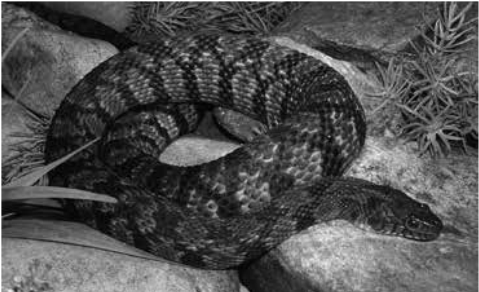
Fig. 4. Diamantrug waterslang ( Nerodia rhombifer ) vrouw in het aquaterrarium.