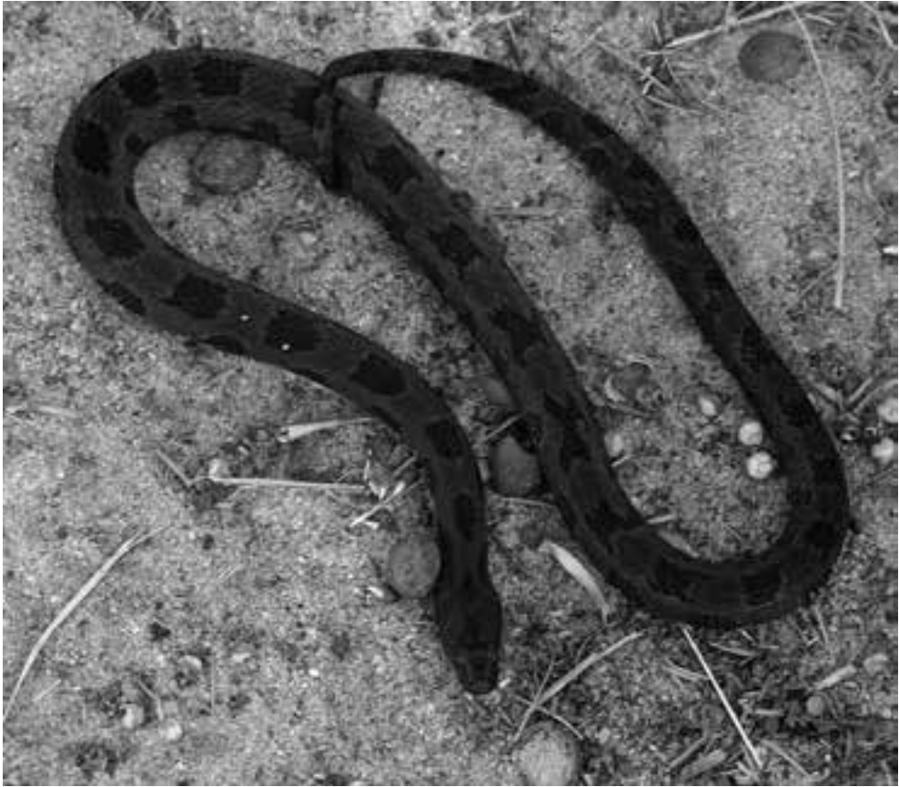
Fig. 5. Bruine waterslang (Nerodia taxispilota) man in Florida.