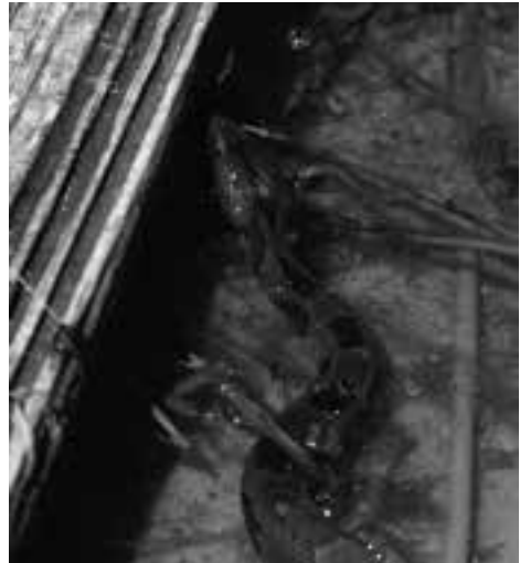
Fig. 6. Bruine waterslang (Nerodia taxispilota) man in Florida. (Foto Paul Storm).