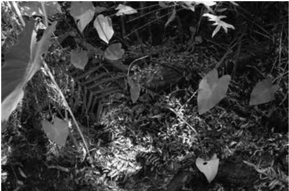
Fig. 2. Nerodia fasciata pictiventris in Florida, rechtsonder is deze slang te zien. (Foto Paul Storm). Fig. 2. Nerodia fasciata pictiventris in Florida, bottom right. (Picture Paul Storm).