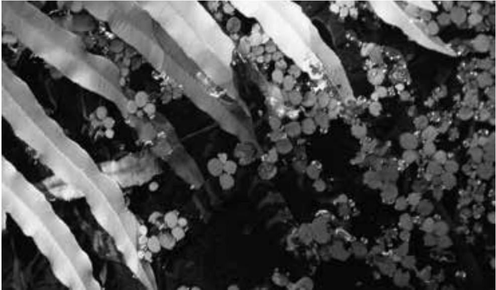
Fig. 3. Ondiep poeltje in Florida met jonge Nerodia fasciata pictiventris . Volwassen dieren (zie Fig. 2) werden aangetroffen kruipend over het land, jonge dieren met name in het water waarschijnlijk jagend op muskietenvisjes ( Gambusia ).